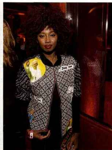
▲ SAINTE NUIT La sublime chanteuse franco-malienne Inna Modja.