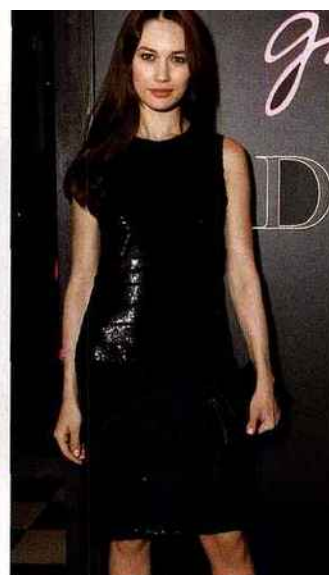
► FRANCE-UKRAINE L'actrice Olga Kurylenko, qui sera le 16 mars à l'affiche du film Un jour comme un autre , avec Benicio Del Toro.