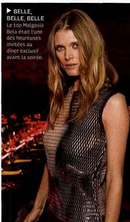
► BELLE, BELLE, BELLE Le top Malgosia Bela était l'une des heureuses invitées au dîner exclusif avant la soirée.