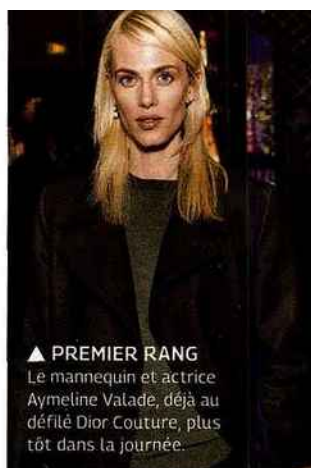
▲ PREMIER RANG Le mannequin et actrice Aymeline Valade, déjà au défilé Dior Couture, plus tôt dans la journée.