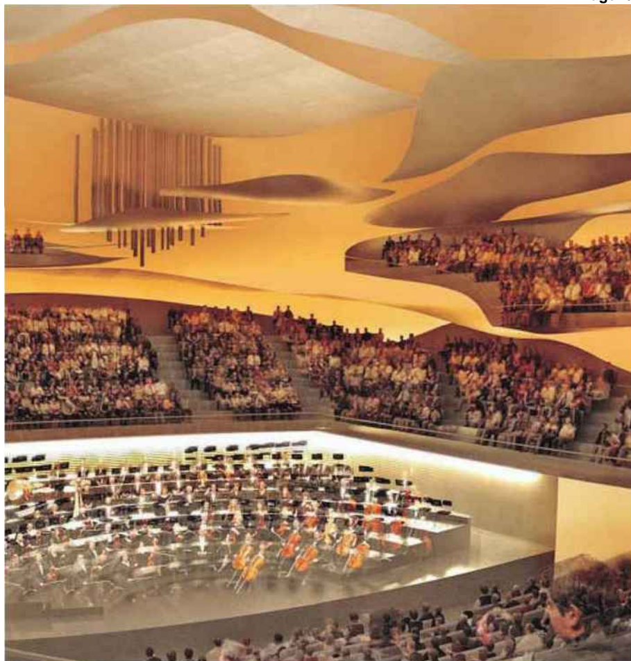
La grande salle de la Philharmonie de Paris (XIX e ), une prouesse acoustique.

CHÂTEAU DE VERSAILLES. L'architecte Dominique Perrault a repensé l'accueil au château, qui était un peu chaotique. Au prin-