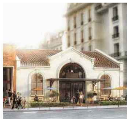
Le Hasard Ludique, avenue de Saint-Ouen (XVIII e ).

MUSÉE HENNER. Installé dans un hôtel particulier du XIX e siècle, cet appartement-atelier est typique de la demeure d'un artiste « officiel » du XIX e siècle. Réhabilitation de son salon aux colonnes et de son jardin d'hiver (avec une nouvelle verrière), mais aussi ouverture d'un café. 43, avenue de Villiers (XVII e ). Réouverture en novembre 2015.