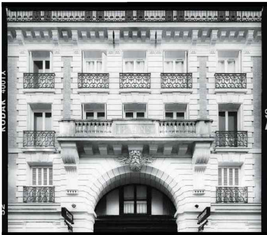
Nouvelle métamorphose pour les célèbres bains-douches de la rue du Bourg-l'Abbé (III e ).

LE SAINT. Le petit hôtel de 18 chambres totalement haussmannien de Pierre Moussié (encore lui !) ouvrira au printemps. 90, rue René-Boulangier (X e ). Ouverture en mars.