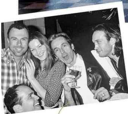
Le couturier Thierry Mugler, Carla Bruni dans sa période mannequin, et Vincent Perez dans sa période Carla Bruni.